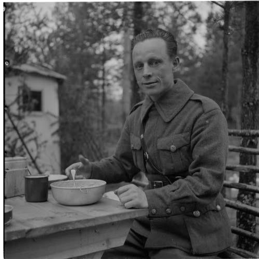
Heimoupseeri ruokapöydässä.