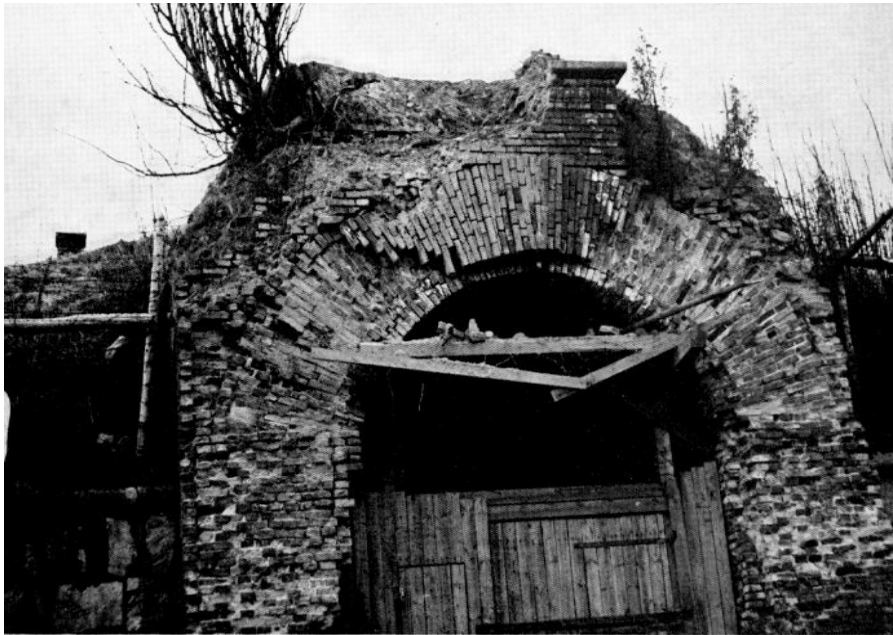
Kuva 4: Linnoituksen lounaisportin kunto vuonna 1951

kokonaan romahtaneesta pääportista (koillisportti). 1950- ja 1960-luvuilla linnoituksen kunnostus oli kuitenkin lähes täysin vailla huomiota.