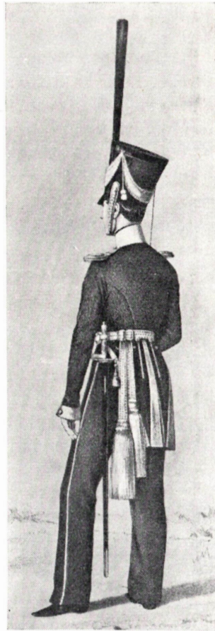
Kuva 4. V:n 1826 upseeriunivormu suorine, vihreine ja sinisellä saumanauhalla varustettuine housuineen.

Aliupseerien univormu oli kauluksen ja hihankäänteiden kultakaluunaa lukuunottamatta samanlainen kuin miehistönkin. Päällikön luvalla he saivat käyttää — ei kuitenkaan paraateissa ja suuremmissa harjoituksissa — upseerien tavoin pitkiä, harmaasta verasta tehtyjä ratsastushousuja varustettuina sinisellä saumanauhalla. (Upseereilla