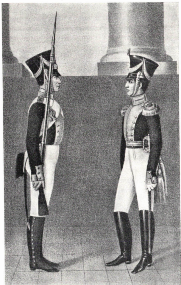
Kuva 2. V:n 1819 jalkaväkirykmenttien upseeri ja aliupseeri. Officer and non-commissioned officer of the infantry regiments of 1819.