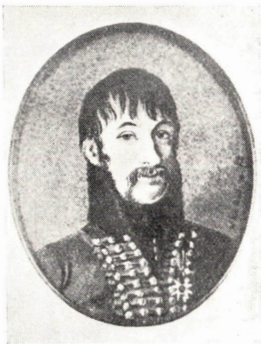
Bild. 3. Kapten Gustav Magnus Duncker, 1779—1827. Miniatur, sign. V. Le Moine pxt. 1810.

Ytterligare ett dolmaporträtt av samma kategori som ovan omnämnda framlägges till slut för att förstärka teo-