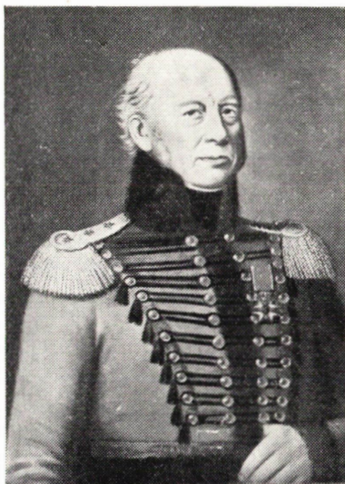
Bild 1. Överste Adolf Ludvig Christiernin, 1765—1842. Mål- ning av J. E. Lindh. — Finlands Nationalmuseum.

Framför mig på skrivbordet ligger ett foto av en porträttmålning tillhörande Finlands Nationalmuseum och signerad J. E. Lind. Porträttet i bröstformat framställer en kraftigt bygd, tydligen högre man, troligen i 65—70-årsåldern. Denne herre är iförd en uniformsjacka av husartyp med hög, pälsbrämrad krage och ner till skärpet nående päls slips, som döljer livplaggets sprund. Även längs plaggets underkant löper en smal pälsrand och ärnuppslagen utgöres av päls. Från slipsen utstråla 10 par tofsprydda "revben" mellan svagt konvexa, blänkande runda knappar. På axlarna epåletter, vardera med 3 stjärnor i rad, och från dess små plattor hänga styva buljonger ner som sprätande små dansöskjolar. Bilden föreställer f.d. översten i svenska armén G. A. L. Christiernin, f. 1765 på Ekolsund i Sverige och död i Åbo 1842.