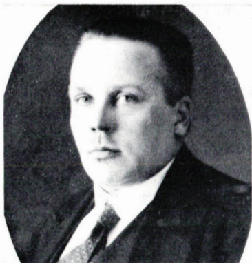
Juho Niukkanen Kansanedustaja, ministeri, puolustusrevisionin jäsen

Member of Parliament, minister, member of the Defence Revision Commission