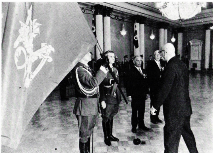
Tasavallan presidentti luovuttaa Sotakorkeakoululle lipun 9. 5. 1969. Taustalla pioneeriliput odottavat vuoroaan.