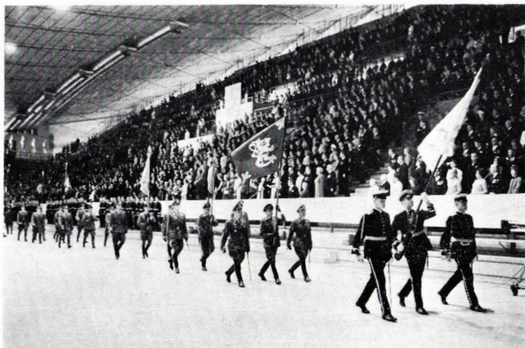
Lippuesittely Puolustusvoimain 50-vuotisjuhlassa Helsingin jäähallissa 4. 6. 1968. Etumaisena Kadettikoulun, seuraavana Tais- telukoulun lippu.