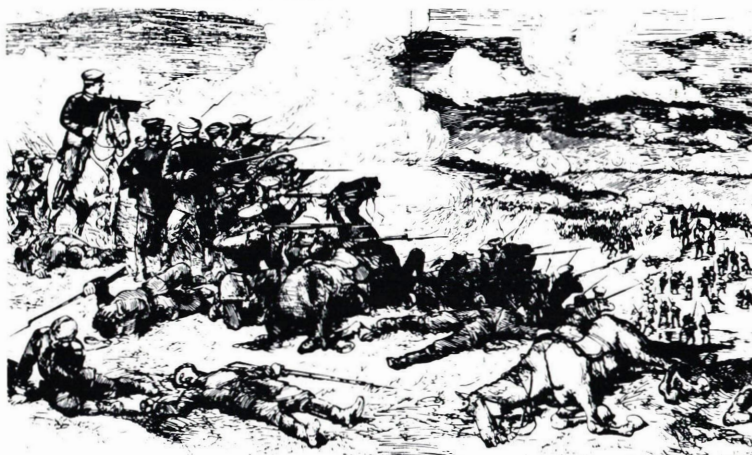
Venäläiset kaartinjoukot hyökkäävät Gornî Dubnikin taistelussa 24. 10. 1877.