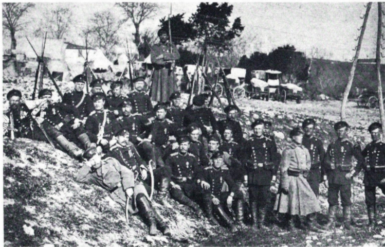
4. komppanian miehiä keväällä 1878 lähellä San Stefanoa.

The officers of the Finnish Guards Battalion during the Turkish War in 1877—1878.