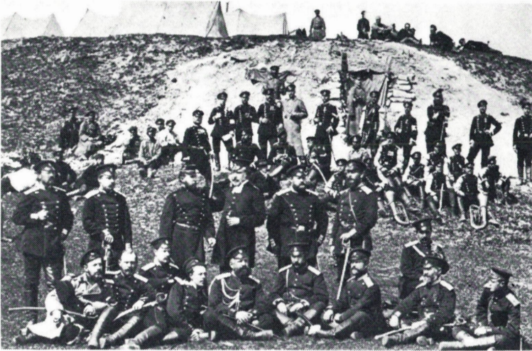
Suomen Kaartin päällystöä Turkin sodassa.

The officers of the Finnish Guards Battalion during the Turkish War in 1877—1878.